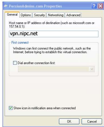
۸- از این قسمت هم می‌توانید آدرس سرور خود را تغییر دهید