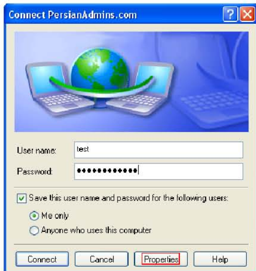
۷- نام کاربری و پسورد خود را وارد کنید